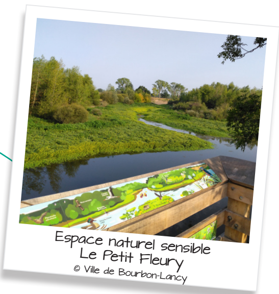
Espace naturel sensible Le Petit Fleury

Labellisé Espace naturel sensible depuis juin 2024, le Petit Fleury est un espace naturel ligérien de plus de 50 hectares. Son île, marqueur fort du paysage, possède une valeur historique et patrimoniale indéniable et sert d'habitat, de refuge et de repère pour la biodiversité. La commune de Bourbon-Lancy, gestionnaire du site, s'est engagée aux côtés du Département pour la conservation de la biodiversité du Petit Fleury et sa découverte par le public (voir tableau spécifique sur l'autre face).