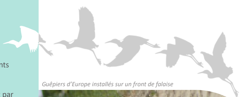
Guépiers d'Europe installés sur un front de falaise

Les bords de Loire sont également riches en falaises sableuses d'érosion qui accueillent les guépiers et hirondelles de rivage. Ces espèces creusent des galeries à même les fronts pour y installer leur progéniture. Leur réussite de reproduction est alors tributaire des crues qui peuvent noyer à la mauvaise période l'ensemble des nids.