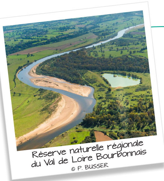
Réserve naturelle régionale du Val de Loire Bourbonnais