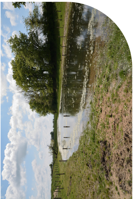
Boire restaurée à Garnat-sur-Engièvre via un Contrat Natura 2000