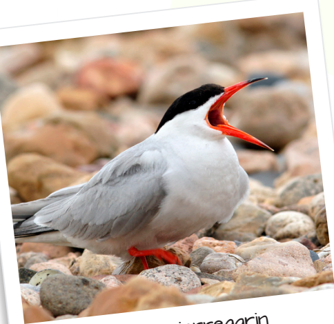
Sterne pierregarin