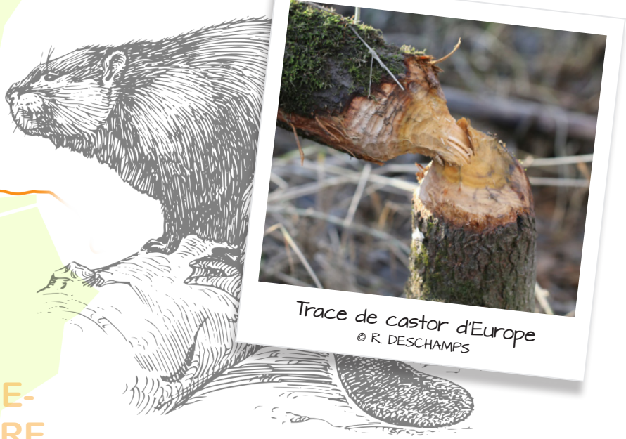
Trace de castor d'Europe

Le castor d'Europe est le plus gros rongeur de France, et même de l'hémisphère nord. Longtemps chassé, il a failli disparaître de nos contrées. Heureusement, son classement comme espèce protégée lui a permis de regagner petit à petit ses territoires où il est aujourd'hui bien présent.